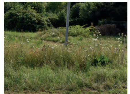
Blühsaum 1, Juli 2019