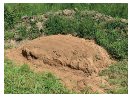
fertiger Sandhaufen, Mai 2019