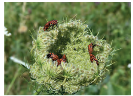
Streifenwanzen auf Wilder Möhre