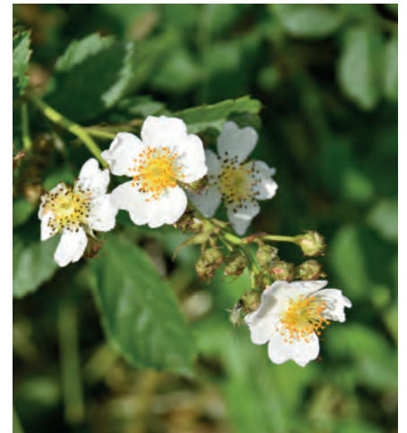
Feldrosenblüte im Mai/Juni 2018