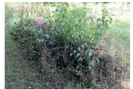
Reisighaufen 2 im Juli 2019