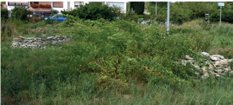
Rosengruppe im Juli 2019