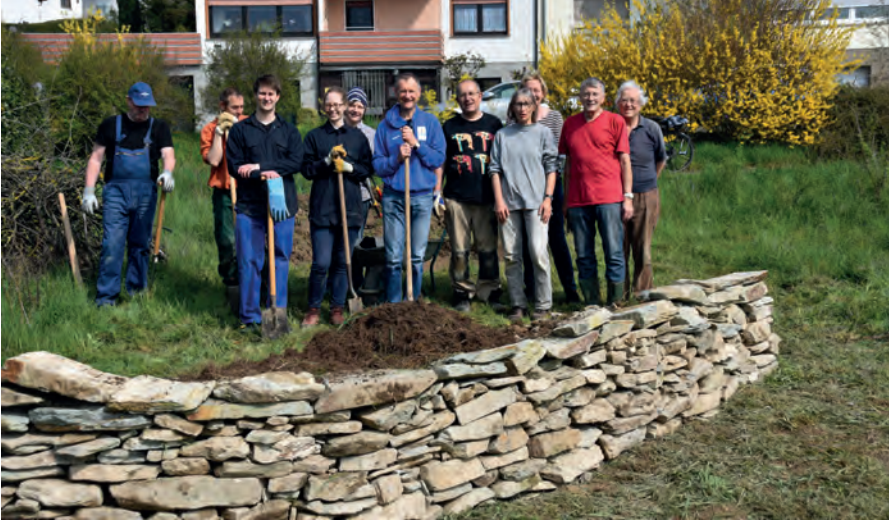
Fertige Trockenmauer mit Helfer*innen von BUND und Imkerverein, April 2019

18. Mai 2019: Anlage eines Sandhaufens für bodennistende Wildbienen