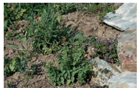
Mauerbepflanzung mit Thymian, Dost und Lavendel, Juli 2019