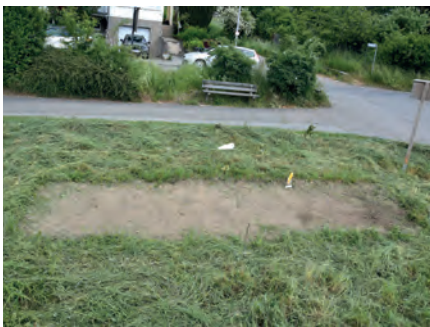
Saatbeet Blühsaum 1, Mai 2018

März-September 2019: Nach Bodenvorbereitung im Frühjahr Einsaat eines zweiten längeren Saumstreifens seitlich des Wirtschaftswegs Richtung Friedhof, wegen der Sommertrockenheit erst im August/September