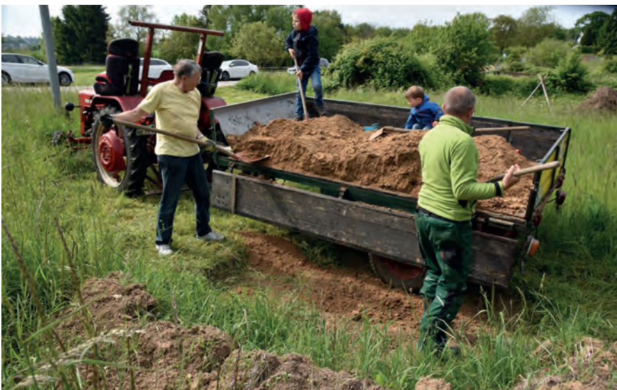
Anlage des Sandhaufens, Mai 2019