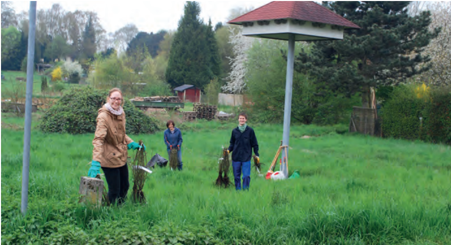
Pflanzung Wildrosen im April 2017

8. April 2017 : Pflanzung von 40 Wildrosen (Feldrose, Hundsrose, Bibernelle, Weinrose), Anlage von 2 Reisighaufen