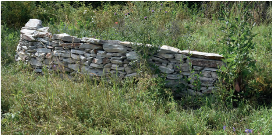
Trockenmauer, Juli 2019