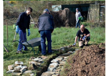
Arbeitseinsatz Trockenmauer, April 2019