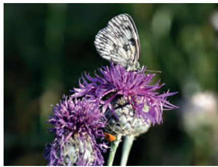
Schachbrettfalter auf Flockenblume