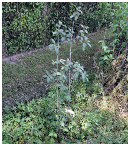
Faulbaum, Juli 2019