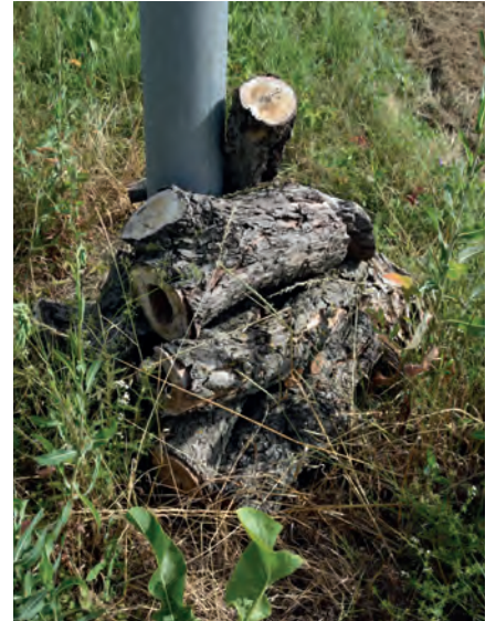
Totholz, Juli 2019