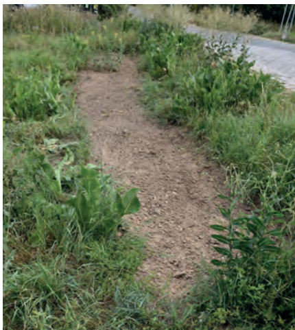
Bodenvorbereitung Blühsaum 2, 2019