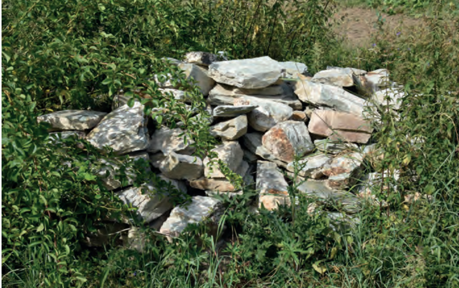
Steinhaufen, Juli 2019

Juni 2019 : Einbringung von Totholz (Obstbaumschnitt BUND-Streuobstwiese Breckenheim)