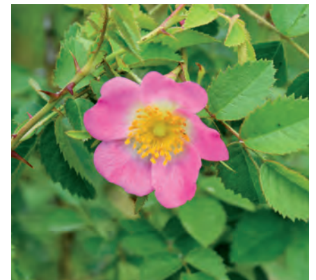
Weinrosenblüte im Mai/Juni 2018