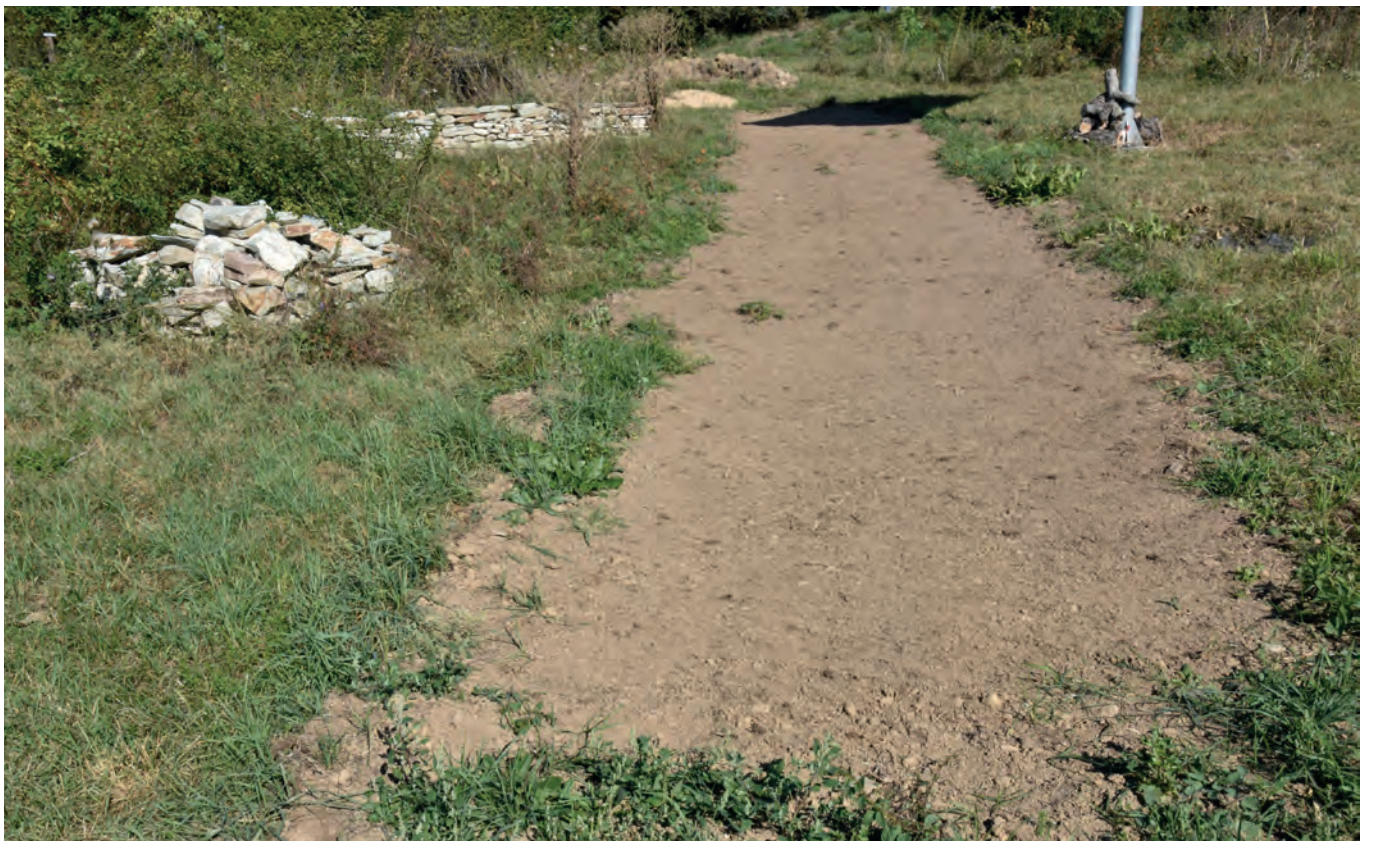
Eingesäter Blühstreifen, September 2019

9. September 2019 : Einsaat (Saatmischung „Wildbienen- und Schmetterlingssaum“, Rieger-Hoffmann)