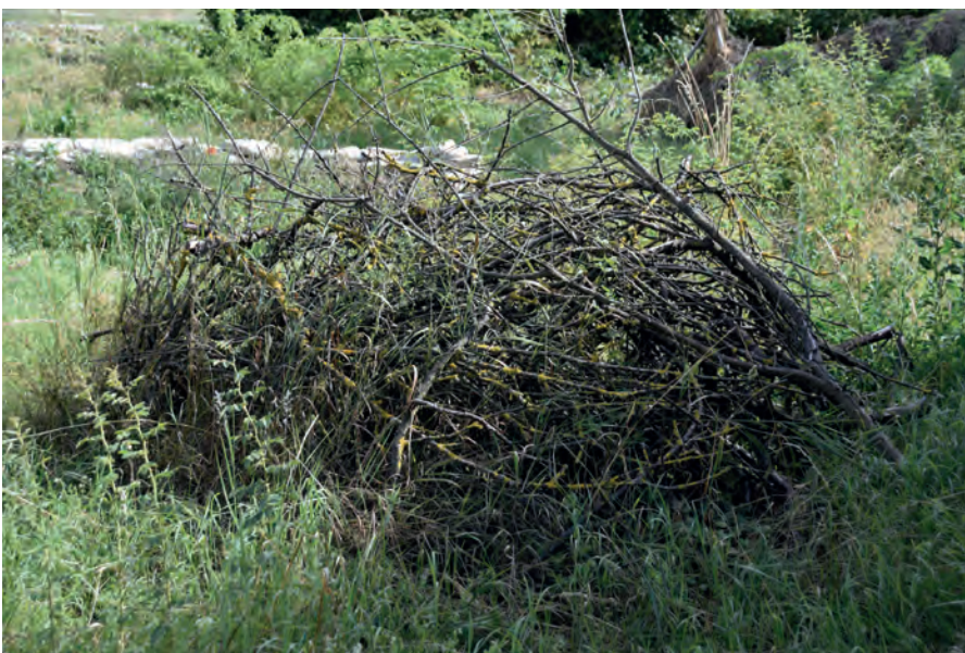
Reisighaufen 1 im Juli 2019