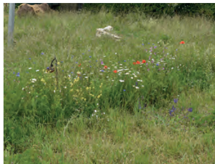
Blühsaum 1, Mai 2019