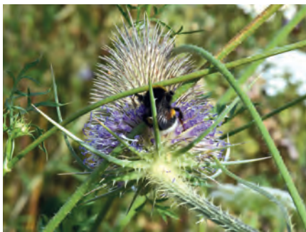
Hummel auf Karde