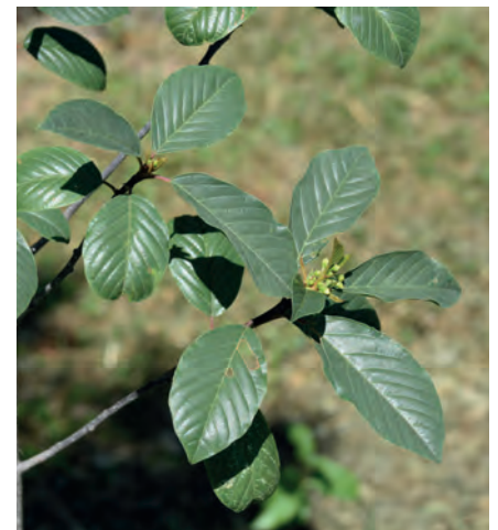
Blütenknospen Faulbaum, Juli 2019